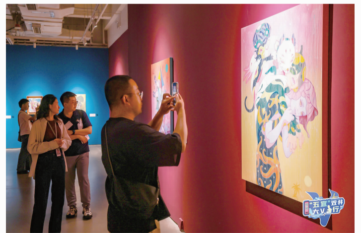
▲ 新浪微博大V参观今日美术馆

接下来,双井街道将陆续推出文化、历史、旅游、休闲等更多具有双井特色的大V行,为国际消费中心城市主承载区和“五宜”朝阳建设贡献双井力量。