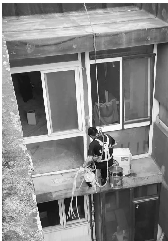
蜘蛛人重新调整空调排水管

庆丰社区在接到居民关于家中天井区域持续漏水的紧急诉求后,立即展现出了高度的责任感与行动力。社区工作人员没有丝毫怠慢,迅速与物业管理部门取得联系,一同前往居民家中的天井区域进行实地查看。一到现场,小组成员们首先着手清理了天井内堆积的垃圾和杂物,为后续的检查工作扫清了障碍。