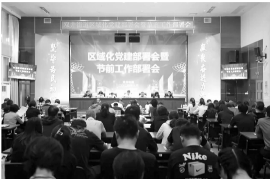
分管领导现场部署工作

各部门、各社区要进一步提高政治站位，以首善标准落实各项服务保障任务。各项工程加速推进，各类安全事故易发，应对自然灾害的工作重点也由防汛转为防火。要认清形势、提高重视，严格落实安全生产责任制，平安建设办公室、各社区要与公安、消防等部门做好配合，围绕辖区重点领域及重点点位，加强日检和夜查，全力以赴保安全、护稳定、促和谐。要做好“大人流”应对，保障好三大商圈周边环境