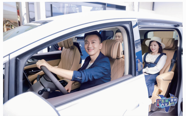
▲ 北京广播电视台主持人在合生汇试驾新能源汽车

连忘返,红色砖体的建筑主体、“之”字形的人馆路径、精美的艺术展陈……让大家在钢筋混凝土组成的森林中找到一方心灵栖息园地,展览延伸出的智能化、全球化、环境保护等问题也引发了大家更多感触和思考。