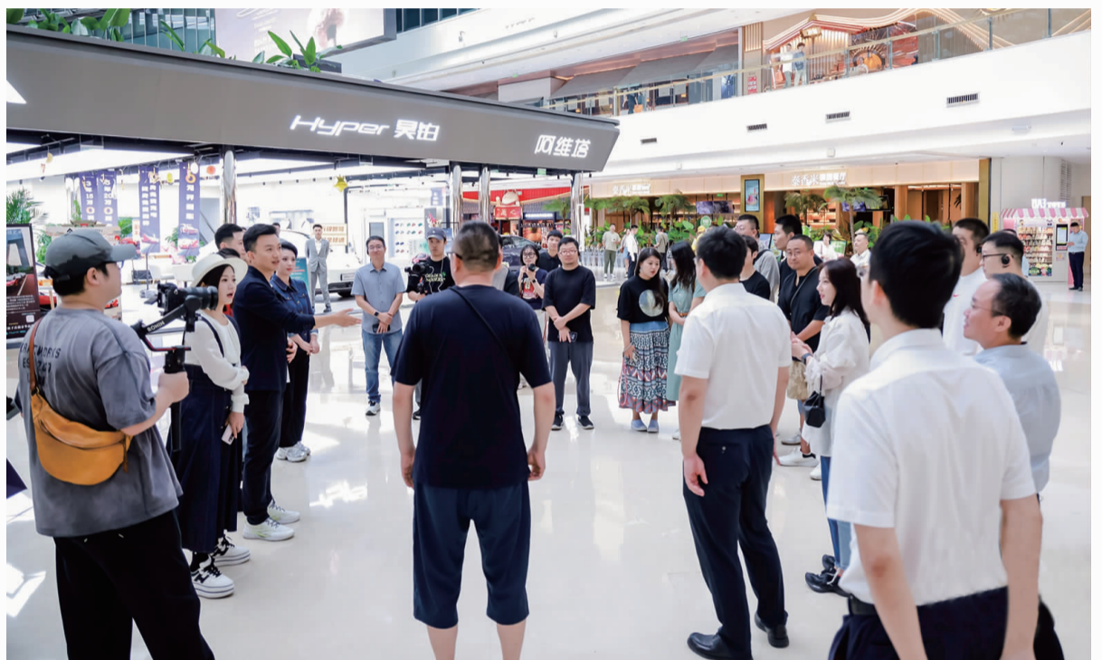
▲ 新浪微博大V和北京广播电视台主持人在合生汇新能源展厅交流此行感受