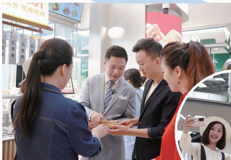
▲北京广播电视台主持人在合生汇品尝美食

此次开展的是“大 V 双井行”的首场探索之旅,通过这次体验路线为居民提供“微度假指南”,更好地感受活力双井、“五宜”朝阳。此行他们有何见闻呢?跟随记者的镜头一起来看看。