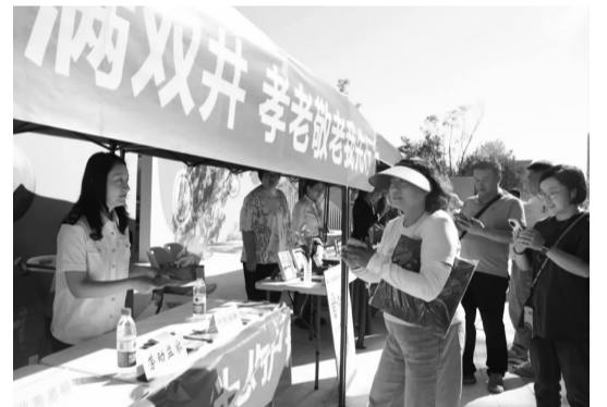
工作人员为居民讲解慈善知识

为了方便辖区居民近距离了解社会救助、参与到公益活动中，9月12日，双井街道举办了一场“小集市大公益”活动，本次活动特意将“大爱慈善你我同行”2024“中华慈善日 朝阳公益周”活动，融入到“小集市大公益”活动中来，让居民体验便民服务的同时，也能献出爱心。