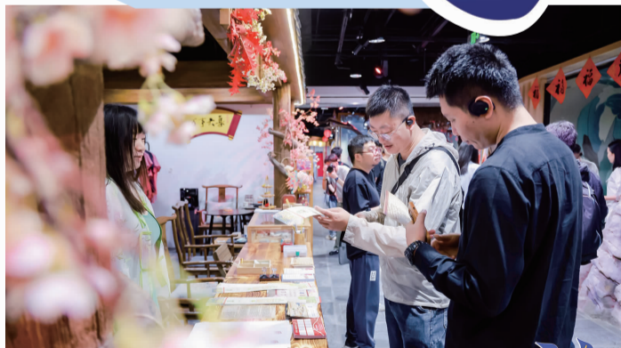
▲新浪微博大 V 打卡富力广场国风市集

今年 6 月,市委统战部在街道设立了全市首个统战工作融入基层党建和社会治理体系试点,试点主要包括“大 V 双井行”“双井大课堂”“美井直播间”三项赋能工程。这不仅是首都统一战线服务中心城区经济社会发展的一个品牌,同时也是双井街道落实党的二十届三中全会精神,提升党建引领基层治理能力的一次探索。